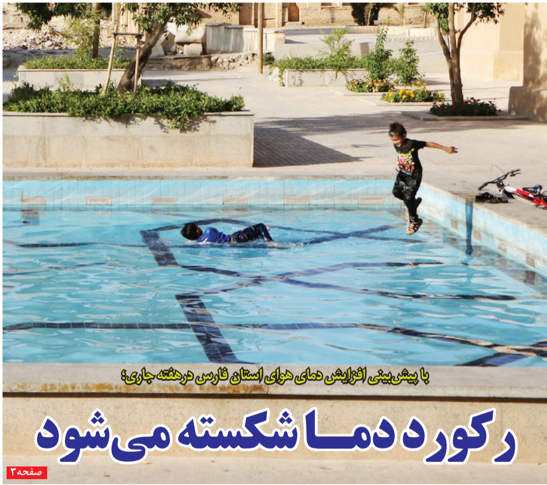
با پیش‌بینی افزایش دمای هوای استان فارس در هفته جاری؟

در این حوزه این رنگ را به دلخواه تعبیر کرده‌اند و هرگاه اسم آن در میان باشد، صداهای خوبی به گوش نمی‌رسد و معنای امیدآفرینی از آن مخایره نمی‌شود. در این حوزه فقط این رنگ فقط سبز نوشته می‌شود اما آن را باید قرمز قلمداد و تفسیر کرد. فقط کفایت این کلید واژه را در شبکه‌های مختلف، در ماه‌های گذشته جست‌وجو کرد. شاهد هستیم این رنگ در این ماه‌ها در غیرانسانی‌ترین شکل ممکن استفاده شده است. با روشن شدن این رنگ چه پیکرها که بر خاک افتاده و چه کودکان بی‌گناهی که زیر آوار ماندند. در چندماه گذشته هر جا نشانی از آوارگی و خون است نامی به نام چراغ سبز در پس از آن می‌آید. در دنیای قدرت‌ها و در دنیایی که هدف وسیله را توجیه می‌کند، رنگ سبز با آنچه در ادبیات و دنیای رنگ‌ها است بسیار متفاوت است. این رنگ در دنیای بین‌الملل، همان رنگی است که با نشان دادن آن توسط برخی قدرت‌ها مجوز اقداماتی صادر می‌شود که خون‌بارترین حوادث را که پیش از آن، بشر گمان به وقوع آن نمی‌برد، به وقوع می‌پیوندد. اوضاع این روزهای جهان و سیاست بین‌الملل و تغییر معادلات بین‌المللی منجر شد از این کلید واژه بسیار استفاده شود و با هر بار نشان دادن جنایت از بی جنایت اتفاق بیفتند.